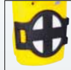
Дополнительный внешний фильтр