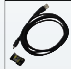
Комплект для подключения через инфракрасный порт