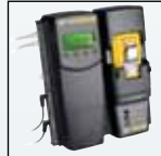
Совместимость с MicroDock II