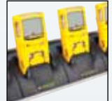
Док-станция для зарядки пяти устройств

Для получения полного списка аксессуаров и принадлежностей обращайтесь в BW Technologies by Honeywell.